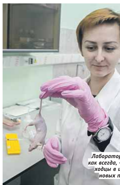
Лабораторные мыши, как всегда, — первопроходцы в испытаниях новых препаратов.

давно объяснили это явление: в пористую среду жидкость проникает не «прямым фронтом» потому, что каждый дефект такой среды становится для жидкости препятствием, которое сначала надо обогнуть, а потом «прорваться» лавиной сквозь него. Но досконально поведение жидкостей при всех возможных препятствиях пока не изучено, а между тем это таит в себе большую пользу для науки и не только. Поэтому на средства мегагранта, полученного Институтом гидродинамики им. М. А. Лаврентьева СО РАН в 2016 году, в институте была создана лабо-