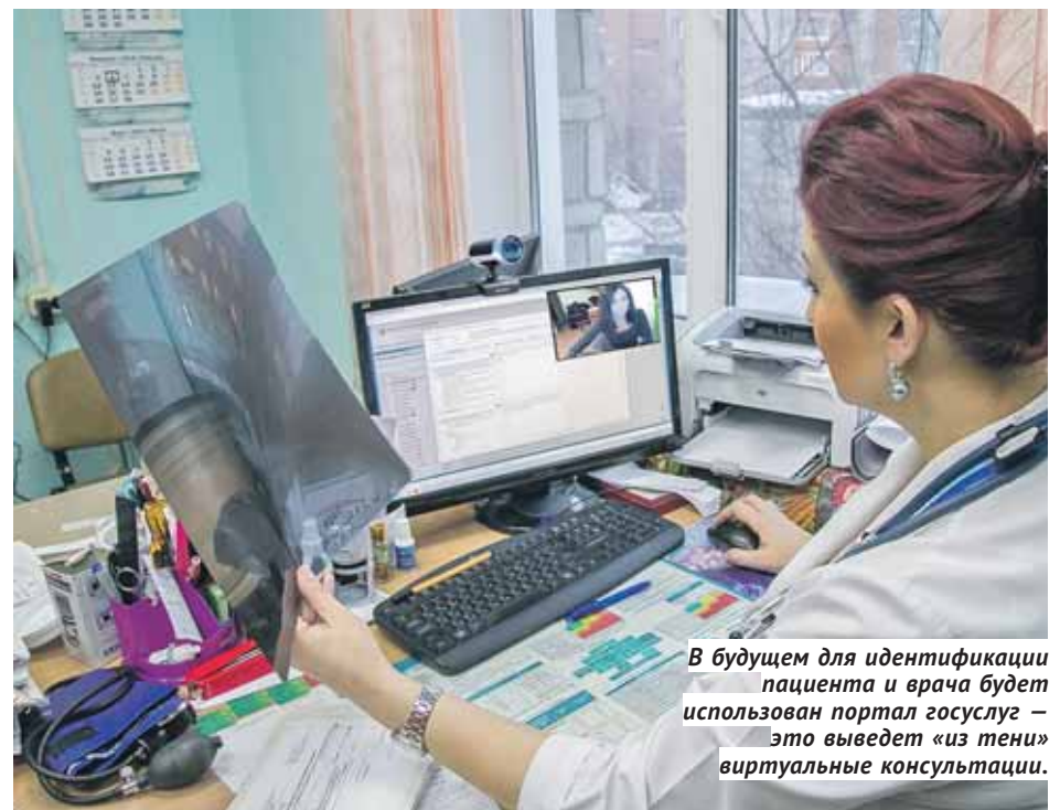
В будущем для идентификации пациента и врача будет использоваться портал госуслуг — это выведет «из тени» виртуальные консультации.