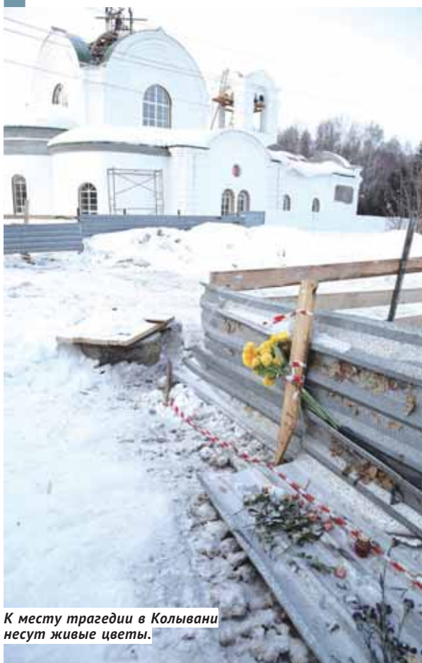
К месту трагедии в Кольвани несут живые цветы.