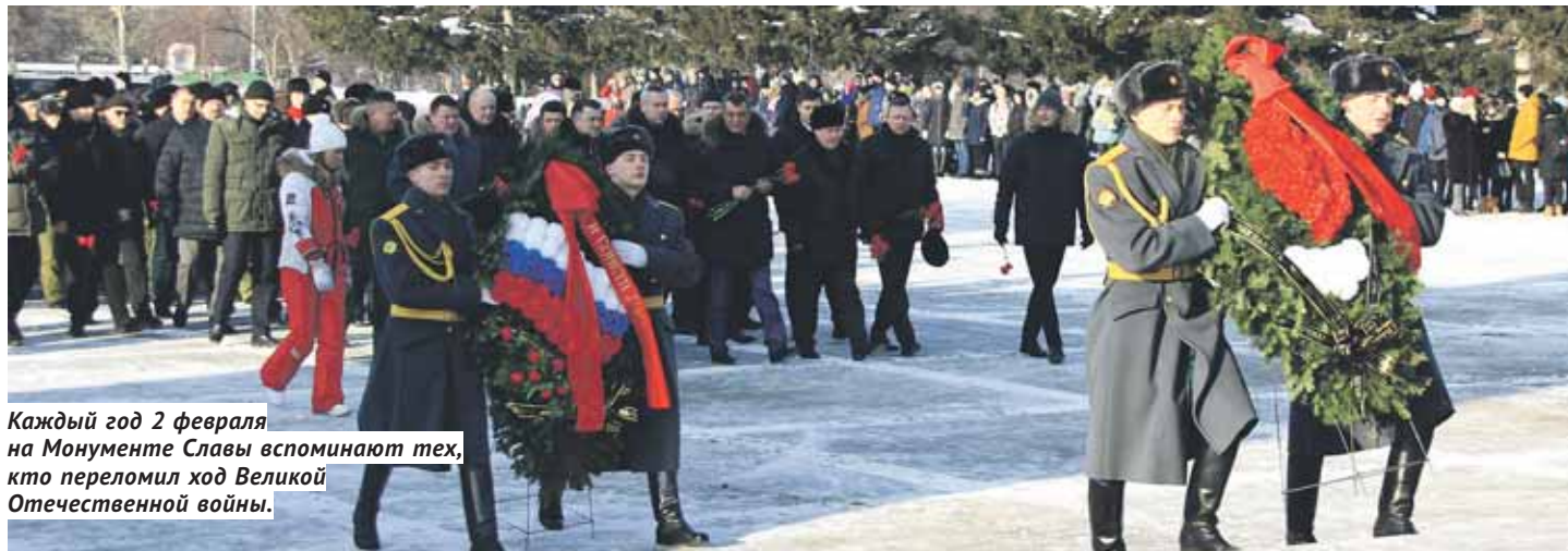
Каждый год 2 февраля на Монументе Славы вспоминают тех, кто переломил ход Великой Отечественной войны.

Полдень 2 февраля выдался в Новосибирске солнечным и морозным. На площади Монумена Славы — торжественно, строго и многолюдно: в день 75-летия победы в Сталинградской битве сотни новосибирцев отдали дань памяти воинам, погибшим в тех страшных боях. Под пронзительные звуки «Прощания славянки» люди несли к Вечному огню красные гвоздики.