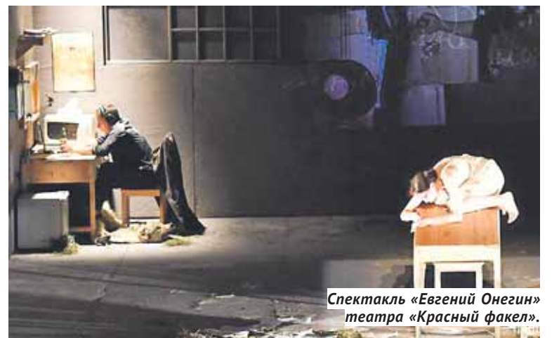
Спектакль «Евгений Онегин» театра «Красный факел».

ТЕАТР «Открытая кафедра» приглашает детей и взрослых, интересующихся театром.