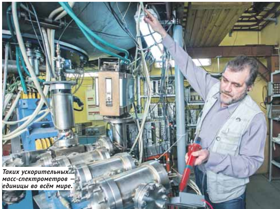
Таких ускорительных масс-спектрометров — единицы во всём мире.

Как слова состоят из бесчисленного набора сочетаний 33 букв, так и геном чело-